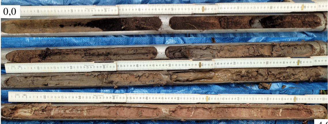
Fotodokumentation BS 2/25